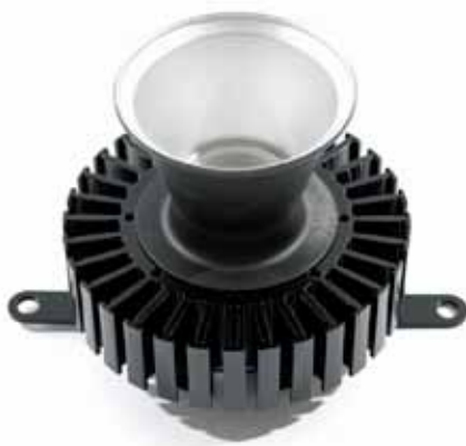
Afbeelding 2: NU-Led