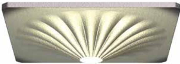
Afbeelding 1: DE NOOD® Spiegel